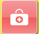
応急手当の重要性